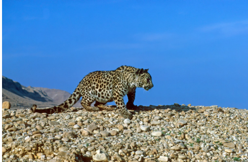
תמונה 8: אחת הנמרות האחרונות במדבר יהודה בדרדרות מעל נחל דוד, 1984