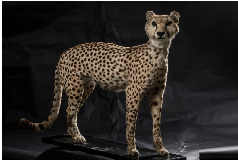
תמונה 9: פוחלץ ברדלס מאוסף האב שמיץ

והשליכו אבנים לעבר הנמר המפוחד, והוא החל להתרחק לאטו. הצעקות הגיעו לאוזניו של פלאח בעל רובה, והוא נזעק למקום בהניחו שפרץ ריב בין הרועים. בראותו את הנמר ירה לעברו. בראשונה החטיא, אך הירייה השנייה אך הרעישה והחיה נפלה שדודה.