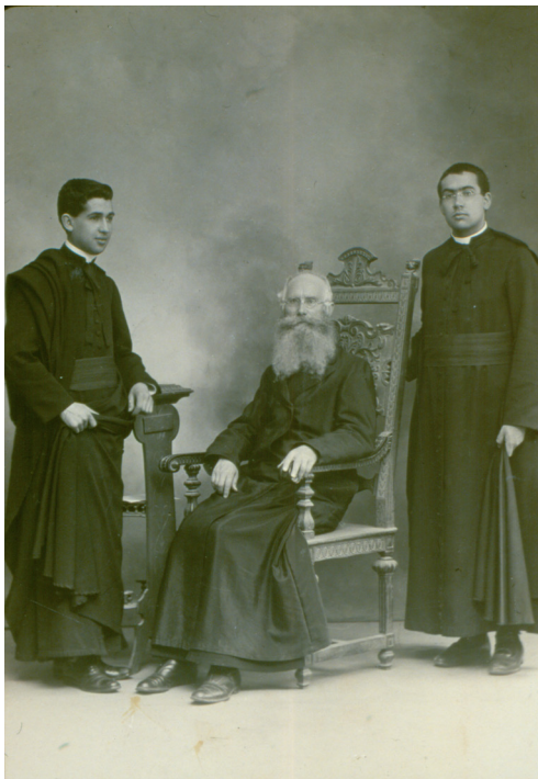
תמונה 1: האב ארנסט שמיץ, 12 ביוני 1914

ההיסטוריה הזואולוגית של ארץ ישראל בשני העשורים הראשונים של המאה ה-20 היה הכומר הקתולי הגרמני, איש המסדר הלזריסטי, האב ארנסט שמיץ. הוא נולד בגרמניה ב-18 במאי 1845. משנת 1864 למד בבית הספר של המיסיון של וינסן-דה-פול מן הלזריסטים, והוסמך ככוהן דת. בשנת 1873, במסגרת "מאבק התרבות" בגרמניה, גורש האב שמיץ. הוא עבר לאי מדירה, שם ניהל אכסניה ומוסד הכשרה לכוהני דת, וייסד מוזיאון למדעי הטבע שהפך לאחת האטרקציות המרכזיות באיים.