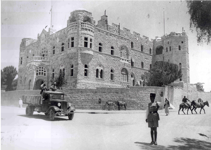
תמונה 2: חזית מבנה אכסניית פאולוס הקדוש במבט משער שכם בתקופת המנדט הבריטי, 1942

הפלא פעל ממש כמו שפועל כיום בית ספר שדה של החברה להגנת הטבע. כותב האב שמיץ: "...החנכים של הסמינר מונהגים על ידי טיולים מתמידים וקבועים בסביבה הקרובה והרחוקה יותר, במטרה לשים לב לכל דבר בשטח, ולאסוף חומר מדעי שיוכל להעמיק את ידע עבודת האל בטבע ולמען התפתחות מדעי הטבע בכלל..." (Das Heilige Lan, 1923, pp 6-7).