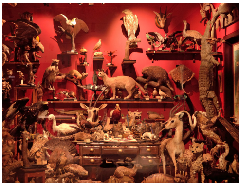
תמונה 5: האוסף של האב שמיץ מוצג מחדש לאחר שיקומו במוזיאון הטבע על שם שטיינהרדט, כ"חדר פלאות" באווירת תקופתו של האב, ובו משולבים אוספיו מארץ ישראל וממדינה

הספר כולל מבואות, ובמרכזו תרגום מגרמנית של אוסף הרשימות ששלח שמיץ ל'ארץ הקדושה'. המאמר