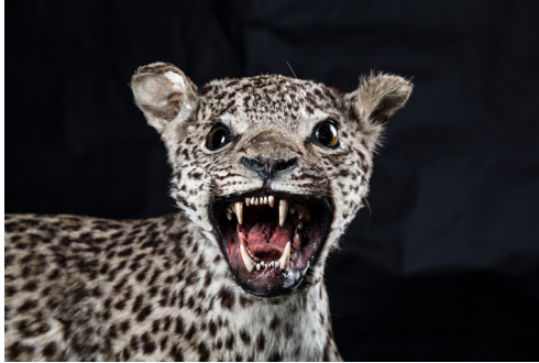
תמונה 7: פוחלץ של נמר מתוך אוסף האב שמיץ

כעת התקיף הנמר את פרצופו של המסכן – הוא קרע את שפתו התחתונה לשלוש וחשף את לסתו, קרע לגזרים את ידיו ובעיקר את רגליו. זעקות הכאב של האב גרמו לבן לשכוח את הסכנה, והוא התקדם עם האקדח בידו אל החיה הזועמת וירה בה מטווח קצר שלוש יריות, שלף את סכין הצייד שלו, דחף אותה ללוע הנמר הפצוע אנושות אך עדיין שואג בקול גדול, וביתק אותו. כדי לנטרל את הנמר לחלוטין נעץ עבד אל עמרי שוב את סכיניו בצוואר החיה וסיף אותו.